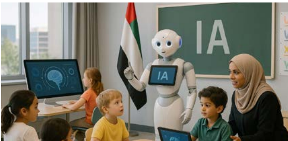
Con la Inteligencia Artificial estamos viajando hacia el infinito.

braya la determinación del país por alcanzar la soberanía tecnológica y fomentar la cooperación global. Todas estas iniciativas convergen en la «Estrategia Nacional de Inteligencia Artificial 2031», una hoja de ruta que trasciende la mera ventaja competitiva para enfocarse en la capacitación del talento humano y el progreso social.