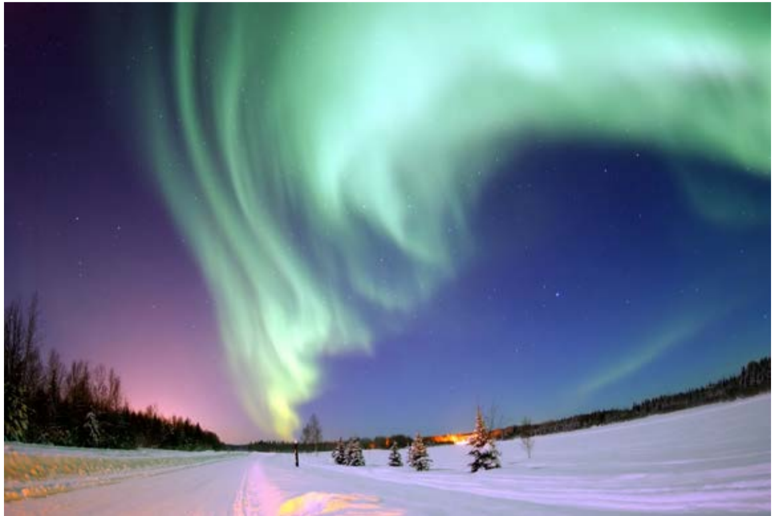
El riesgo es exclusivamente para la tecnología y la infraestructura eléctrica.

A diferencia de los países cercanos a los polos, en Colombia (ubicada en la zona ecuatorial) los riesgos son distintos y se