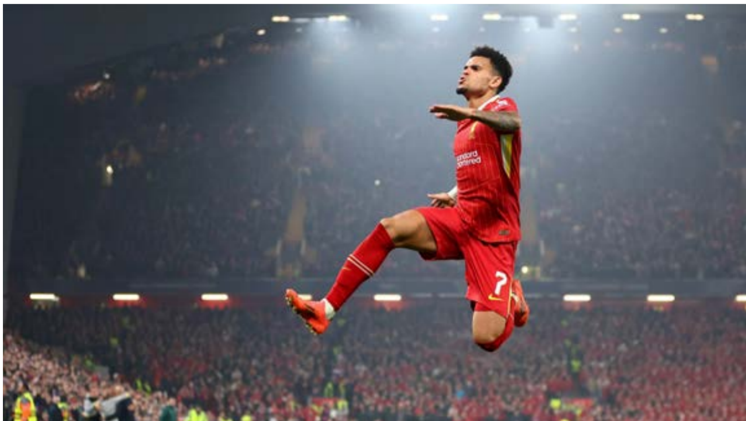
Luis Díaz como candidato firme al Balón de Oro