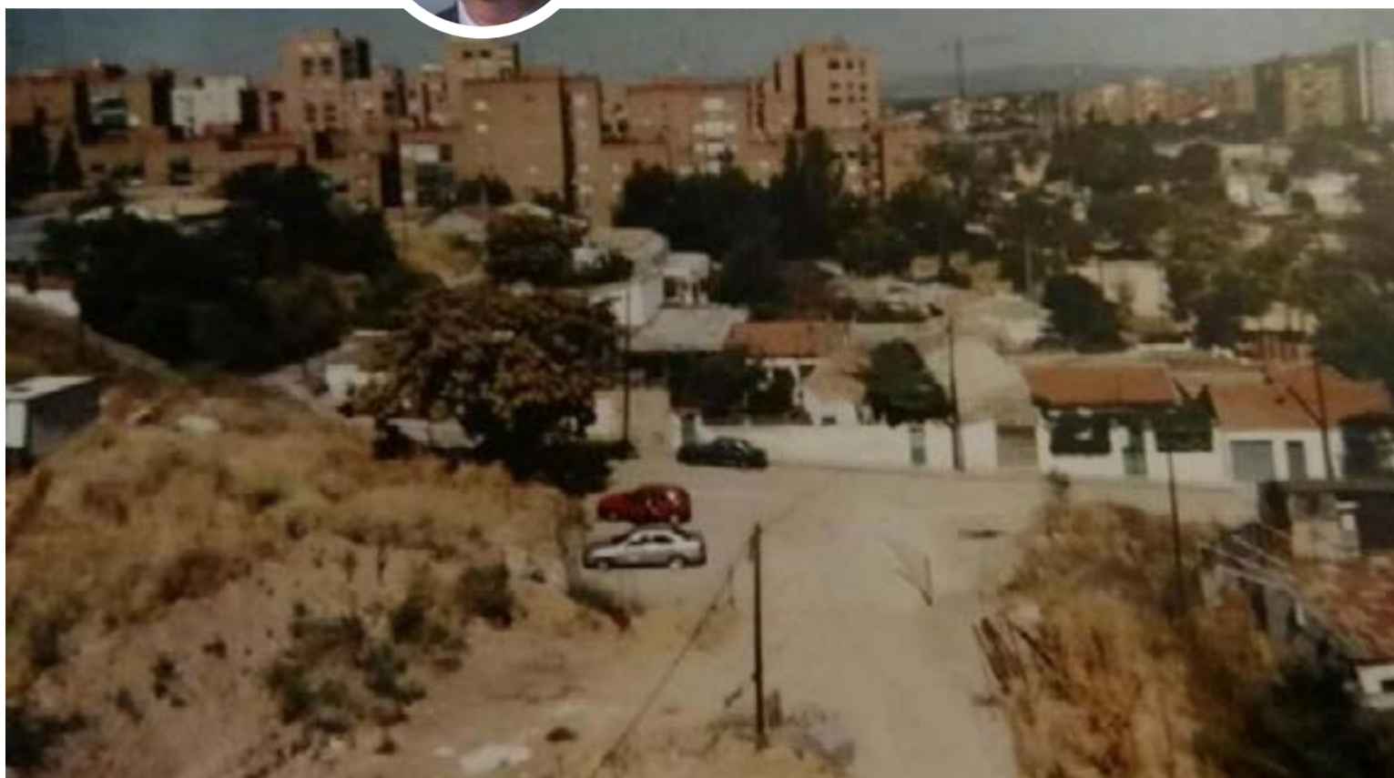
El barrio madrileño que se independizó hace 35 años y pidió asilo a Cuba

Hace 36 años, un barrio de Madrid, España, se declaró independiente y se autoproclamó «reino» por la falta de respuesta de las autoridades ante las necesidades básicas de sus vecinos. Hoy, cuando observamos cómo en Colombia las ciudades parecen cada vez más sitiarse en sus propias lógicas de abandono —con delincuencia sin control, obras públicas eternas e indolencia institucional— no podemos dejar de ver un paralelo inquietante. Las calles bloqueadas, los vecinos exaltados, las rutas de Transmilenio cortadas y los delincuentes envalentonados convierten nuestros barrios bo-