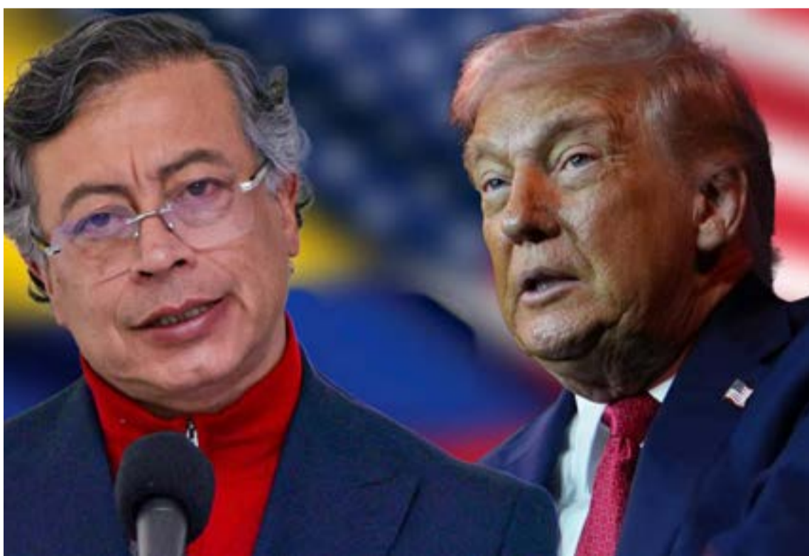
Narcotráfico y Venezuela, los platos fuertes de la reunión.

E l presidente Gustavo Petro encara la misión más crítica de su mandato al aterrizar en Estados Unidos bajo un permiso excepcional de cinco días. Mañana martes 3 de febrero, el Despacho Oval será el escenario de un cara a cara histórico con Donald Trump, en un intento por desactivar meses de hostilidades diplomáticas, sanciones financieras y la reciente revocación de visas al alto gobierno colombiano.