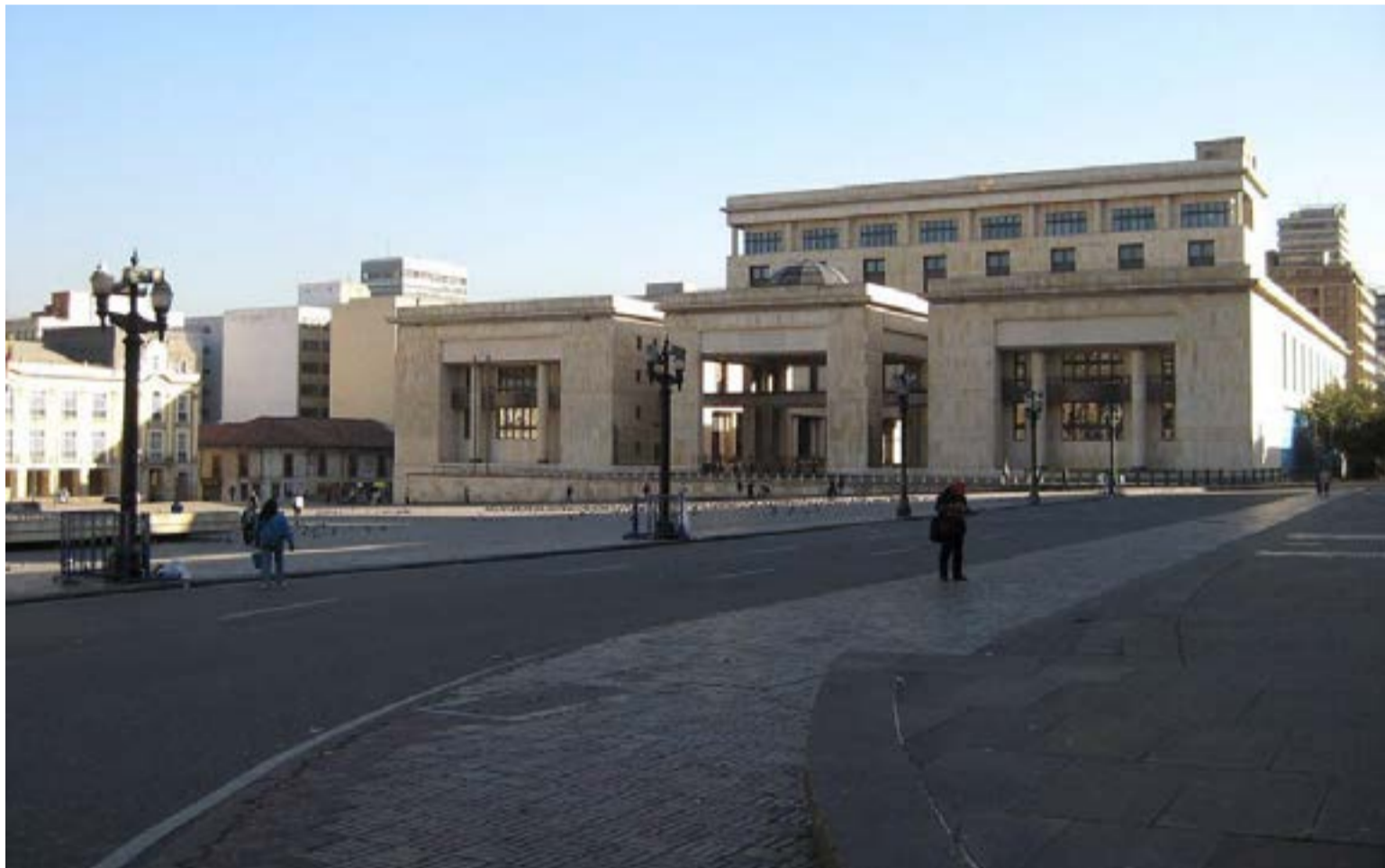
Corte Constitucional. entre «Golpe blando» o rigor constitucional

«Las grietas de la toga: sombras de clientelismo y «puerta giratoria» en las Altas Cortes»