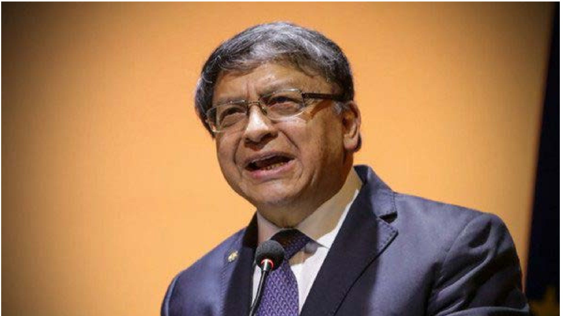
Jorge Enrique Ibáñez Najjar, presidente de la Corte Constitucional