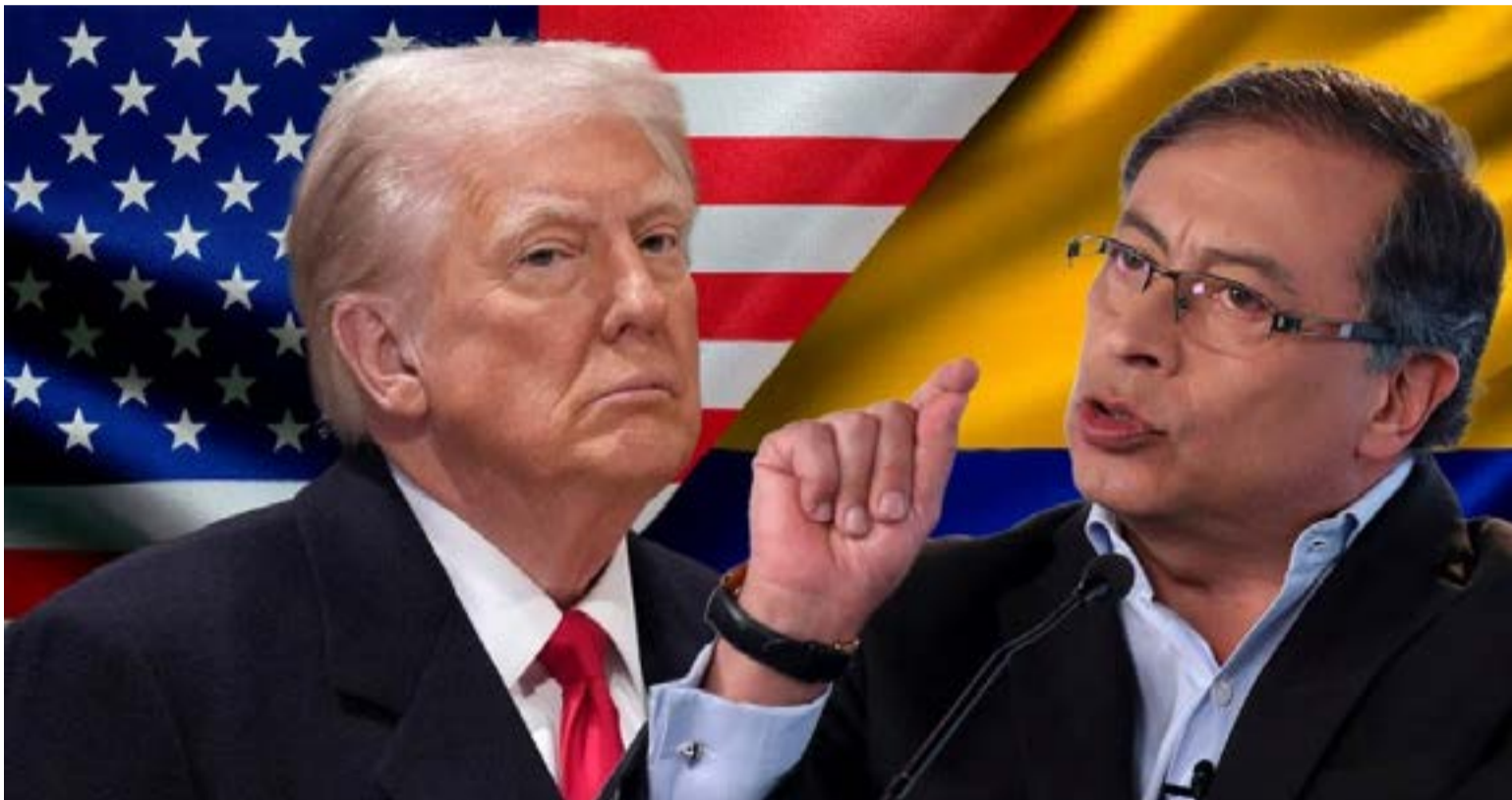
El ajedrez diplomático que se jugará mañana en Washington, los presidentes de Colombia, Gustavo Petro y de Estados Unidos, Donald Trump.