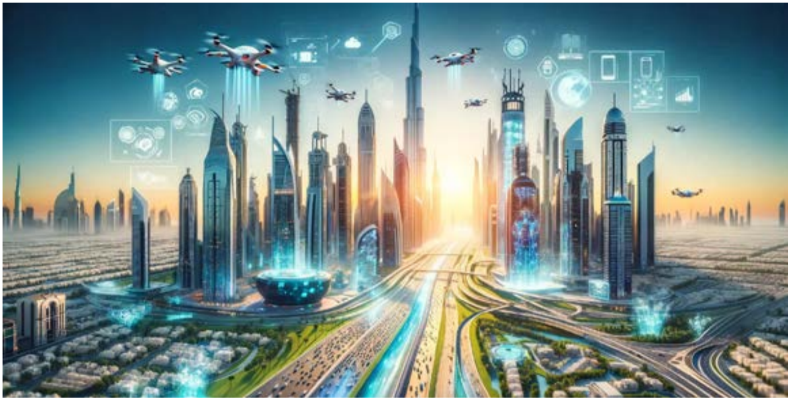
Emiratos Árabes Unidos, un oasis de modernidad e innovación en materia de Inteligencia Artificial.

Uno de los pilares más robustos de esta transformación se halla en el sector salud. Mediante el uso de modelos predictivos y el análisis avanzado de imágenes, el país ha logrado optimizar el diagnóstico clínico y la gestión hospitalaria. Bajo esta visión, la tecnología actúa como un soporte vital que acompaña al