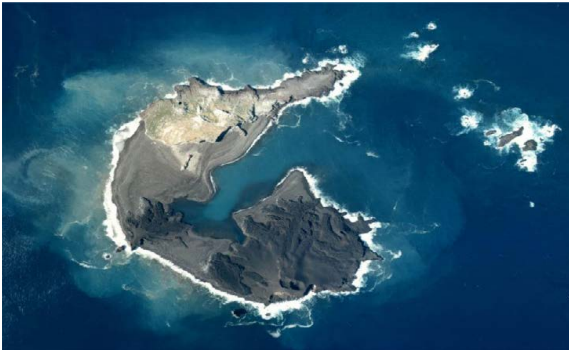
Nishinoshima después de su primera erupción histórica.